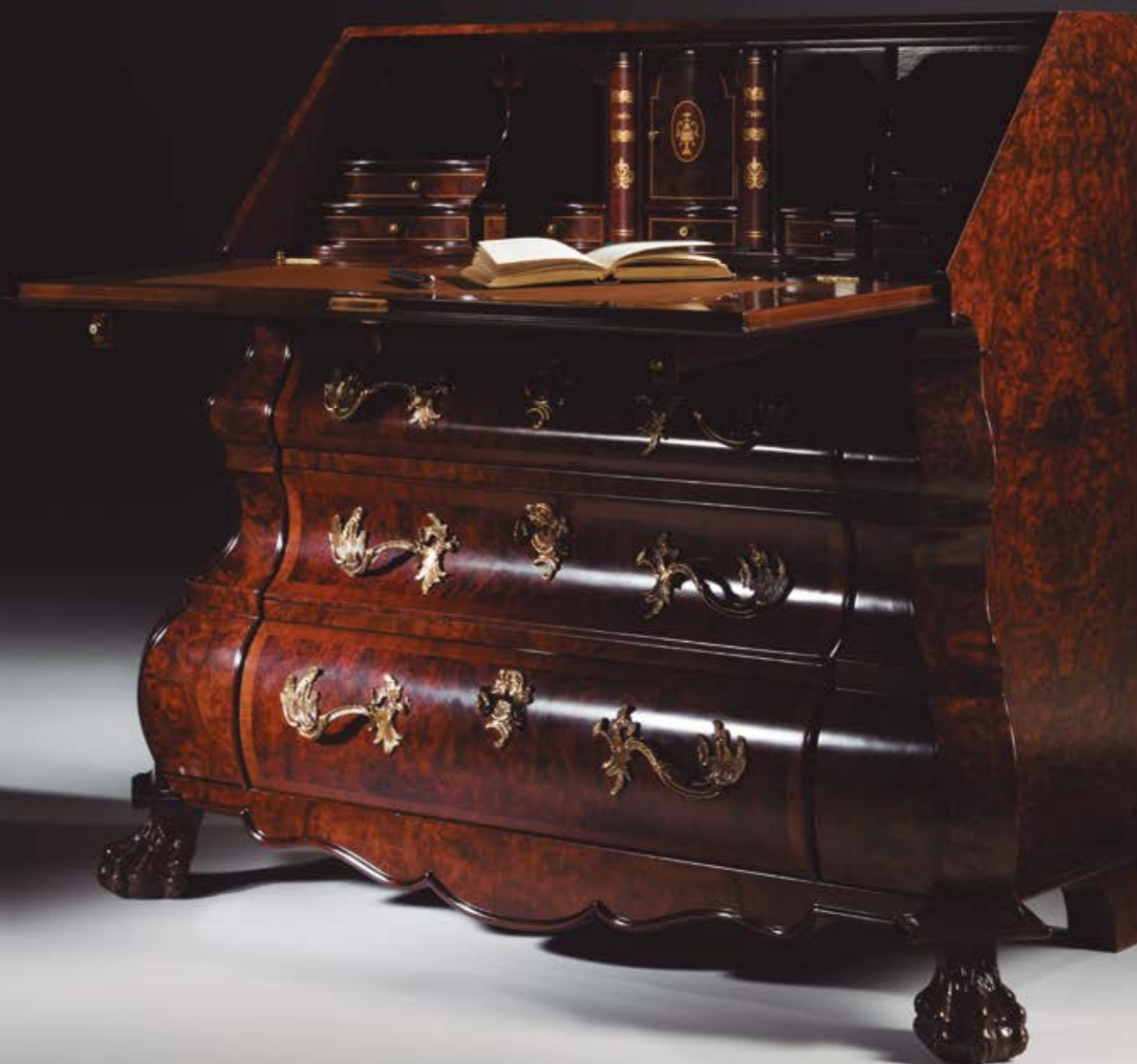
Cerrada/Closed Altura/Height: 101 cm / 39,76" Ancho/Width: 124 cm / 48,82" Profundidad/Depth: 55 cm / 21,65"

Materiales/Materials: Lupa de nogal y bronces / Walnut burl veneer & casted bronzes