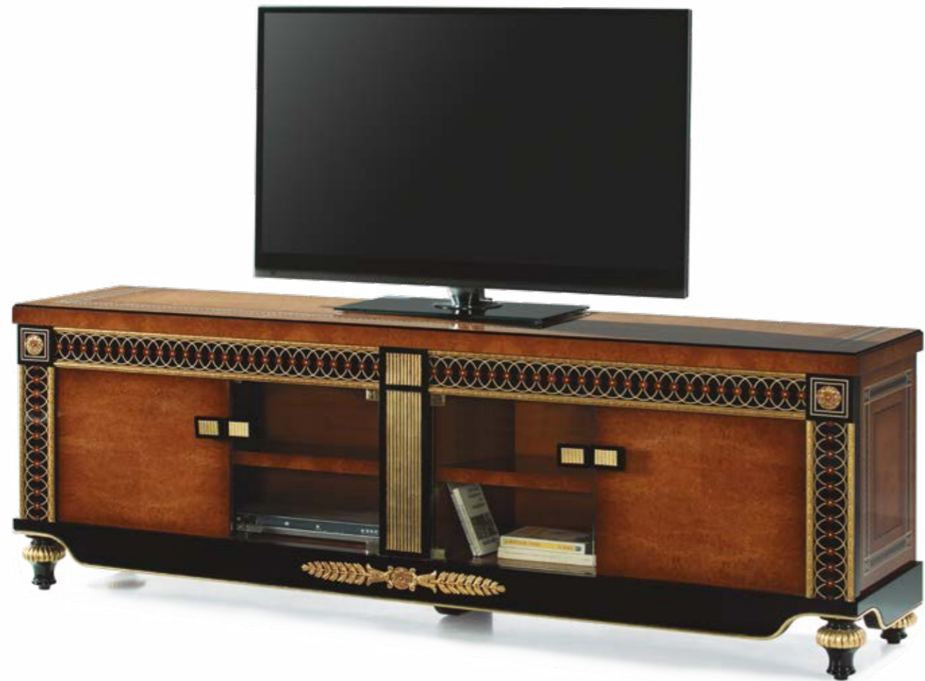
Mueble TV/TV Cabinet – Ref.: 50380 Altura/Height: 76 cm / 29,92" Ancho/Width: 219 cm / 86,22" Profundidad/Depth: 48 cm / 18,90" Peso neto/Net weight: 143 Kg / 314,99 Lb Acabado/Finish: NAN./OF (544/55)

MATERIALS: OAK BURL VENEER, SYCAMORE INLAYS & CASTED BRONZE.