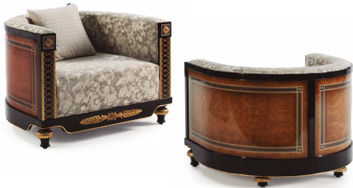
Sofá 1 plaza/Sofa 1 seater – Ref.: 50377 Altura/Height: 78 cm / 30,71" Ancho/Width: 109 cm / 42,91" Profundidad/Depth: 92 cm / 36,22" Peso neto/Net weight: 40 Kg / 88,11 Lb Acabado/Finish: NAN./OF (544/55) Tela / Fabric n°: 245.029/245.027

MATERIALS: OAK BURL VENEER, SYCAMORE INLAYS & CASTED BRONZE.