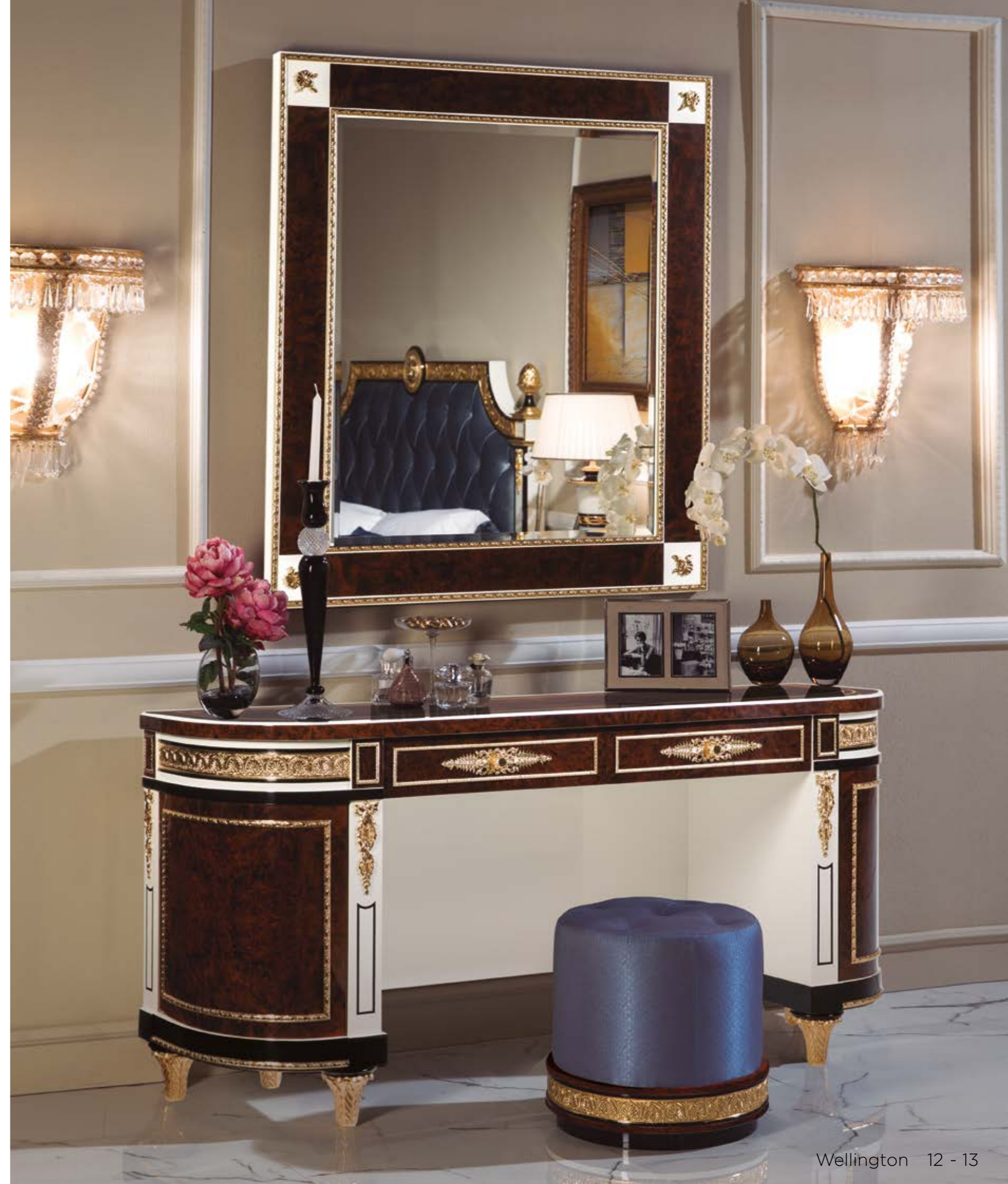
Espejo/Mirror – Ref.: 50302-2 ▶ Altura/Height: 125 cm / 49,21" Ancho/Width: 110 cm / 43,31" Profundidad/Depth: 5 cm / 1,97" Peso neto/Net weight: 33 Kg / 72,69 Lb Acabado/Finish: WE.W.IDB (536/67)

Materiales/Materials: Bronce y lacado negro / Casted bronze & black lacquer