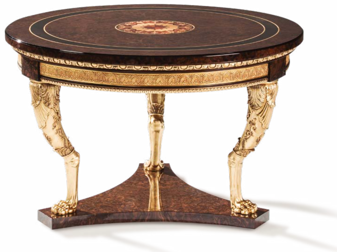
Mesa Redonda/Table – Ref.: 50405 Altura/Height: 80 cm / 31,50" Diámetro/Diameter: 127 cm / 50" Peso neto/Net weight: 80 Kg / 176,22 Lb Acabado/Finish: NO.POE.IOF (435/55)

Materiales/Materials: Chapa de Lupa de Nogal con marqueterías, talla decorada en pan de oro envejecido y bronces / Walnut burl veneer with inlays, hand carved gilded wood & Casted bronze.