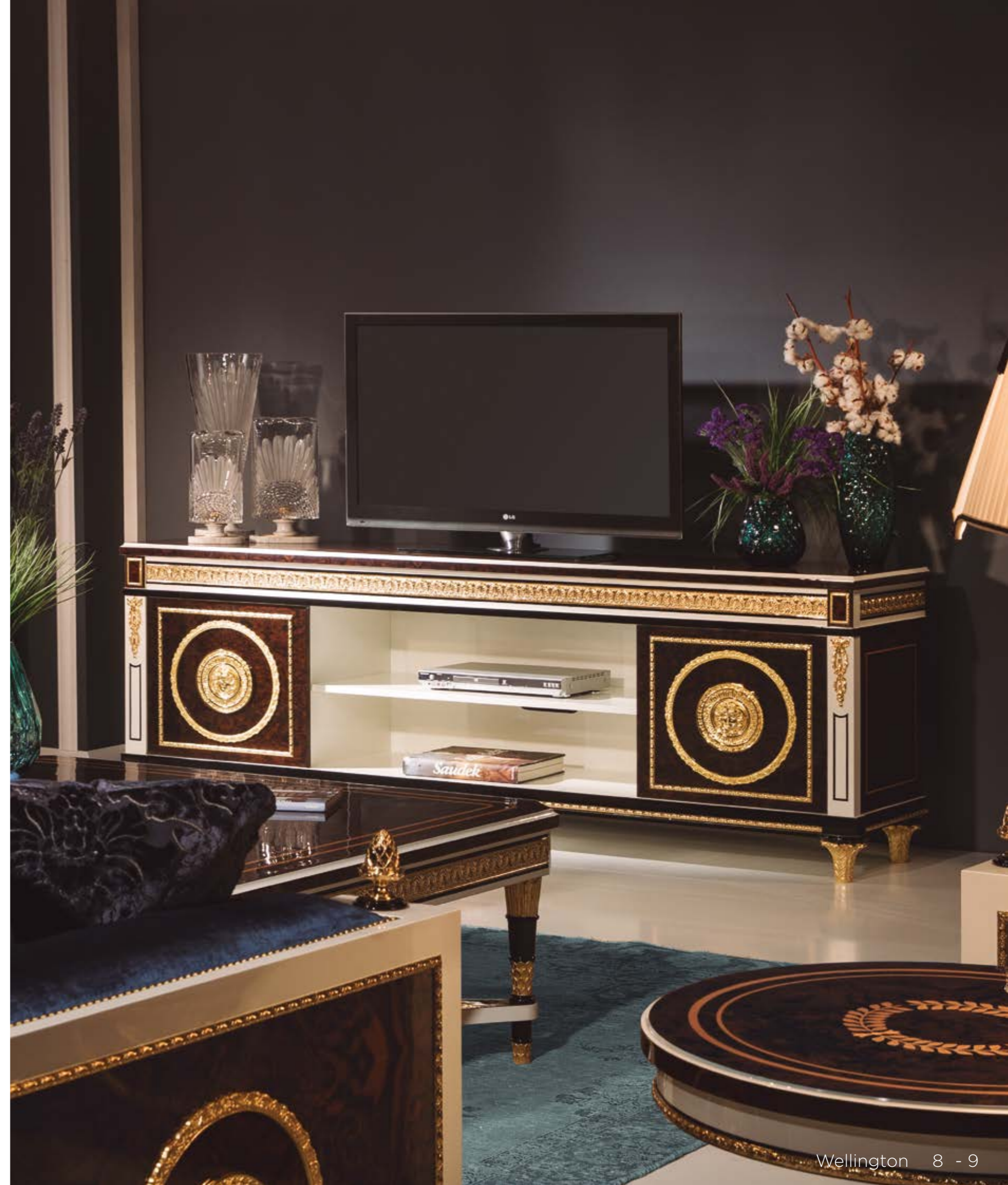
Mueble TV/TV Furniture – Ref.: 50298-2 ▶ Altura/Height: 80 cm / 31,50" Ancho/Width: 220 cm / 86,61" Profundidad/Depth: 50 cm / 19,69" Peso neto/Net weight: 108 Kg / 237,89 Lb Acabado/Finish: WE.W.IDB (536/67)