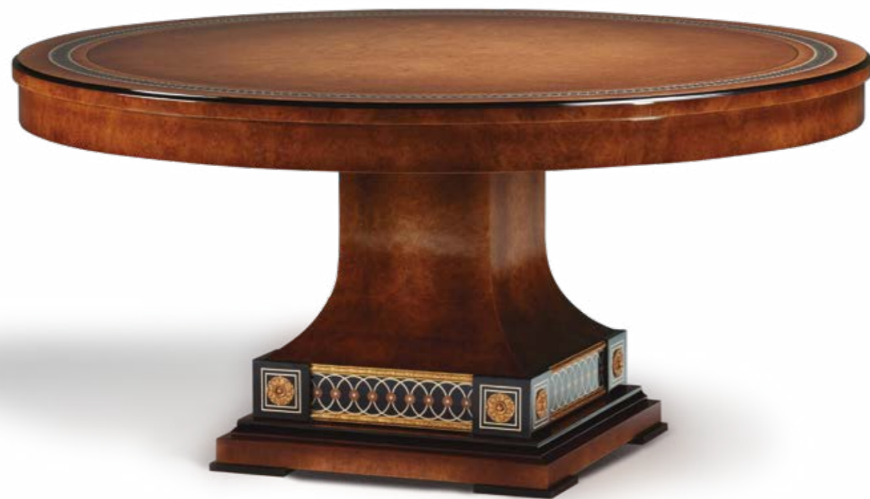
Mesa Comedor/Dining Table – Ref.: 50340 Altura/Height: 81 cm / 31,89” Diámetro/Diameter: 160 cm / 62,99” Peso neto/Net weight: 135 kg / 297,36 Lb Acabado/Finish: NAN.IOF (544/55)

MATERIALS: OAK BURL VENEER, SYCAMORE INLAYS & CASTED BRONZE.