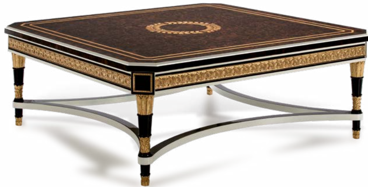
Mesa centro/Coffee Table – Ref.: 50295-2 Altura/Height: 51 cm / 20,08" Ancho/Width: 130 cm / 51,18" Profundidad/Depth: 130 cm / 51,18" Peso neto/Net weight: 55 Kg / 121,15 Lb Acabado/Finish: WE.W.IDB (536/67)

MATERIALS: HIGH GLOSS WHITE, AND WALNUT BURL VENEER, WITH POLISHED BRASS CASTE BRONZE ORNAMENTS AND CARVINGS DECORATED WITH ANTIQUE GOLD LEAF.