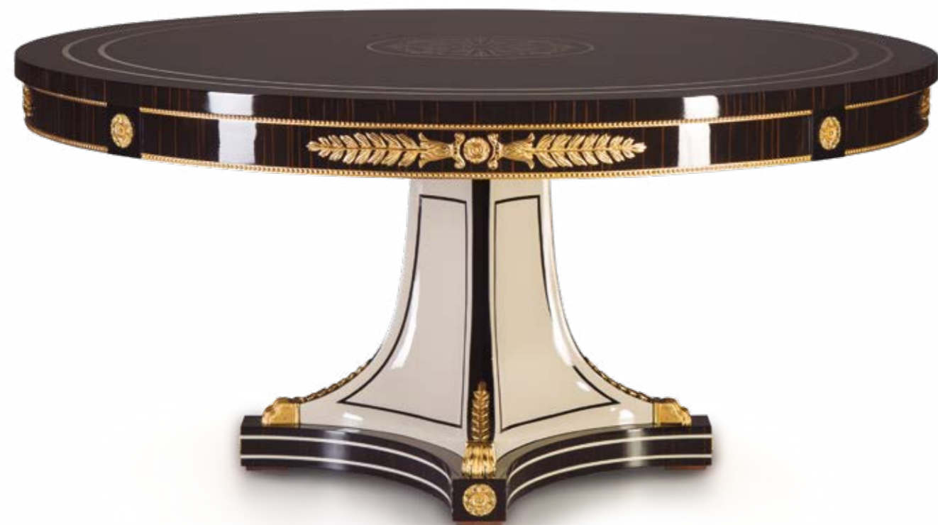
Mesa Comedo/Dining Table – Ref.: 50431-1 Altura/Height: 76 cm / 29,92" Diámetro/Diameter: 160 cm / 62,99" Peso neto/Net weight: 104,00Kg / 229,07 Lb Acabado/Finish: MAM.JOA (560/231)

MATERIALS: MAKASSAR VENEER, WHITE LACQUER & CASTED BRONZE.