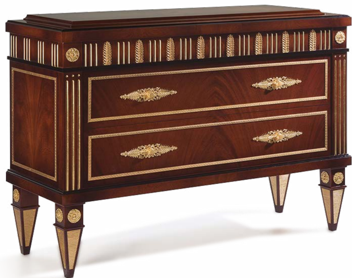
Cómoda/Chest of Drawers – Ref.: 50458 Altura/Height: 100 cm / 39,37" Ancho/Width: 140 cm / 55,12" Profundidad/Depth: 50 cm / 19,69" Peso neto/Net weight: 130 Kg / 286,35 Lb Acabado/Finish: CAMD.B./OA (523/231)

Materiales/Materials: Chapa de Cerejeida y bronce / Cerejeida veneer & Casted Bronze.