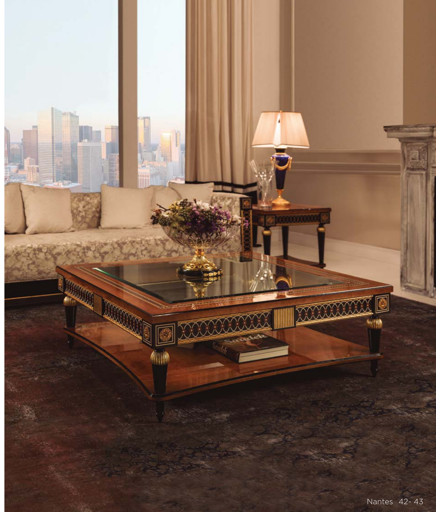
Mesa centro/Coffee Table – Ref.: 50378 ▶ Altura/Height: 47 cm / 18,50" Ancho/Width: 130 cm / 51,18" Profundidad/Depth: 130 cm / 51,18" Peso neto/Net weight: 85 Kg / 187,23 Lb Acabado/Finish: NAN./OF (544/55)