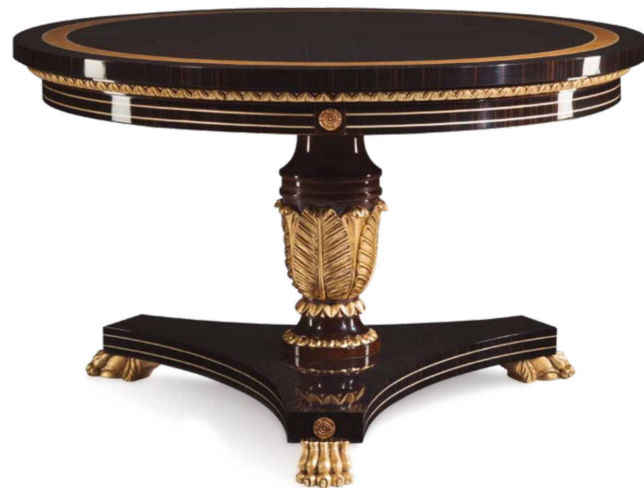
Mesa Comedor/Dining Table – Ref.: 50459 Altura/Height: 78 cm / 30,71" Diámetro/Diameter: 127 cm / 50" Peso neto/Net weight: 74 Kg / 163 Lb Acabado/Finish: MAK.B.IOF. (486/55)

Materiales/Materials: Chapa de Lupa de Nogal con marqueterías, talla decorada en pan de oro envejecido y bronces / Walnut burl veneer with inlays, hand carved gilded wood & Casted bronze.