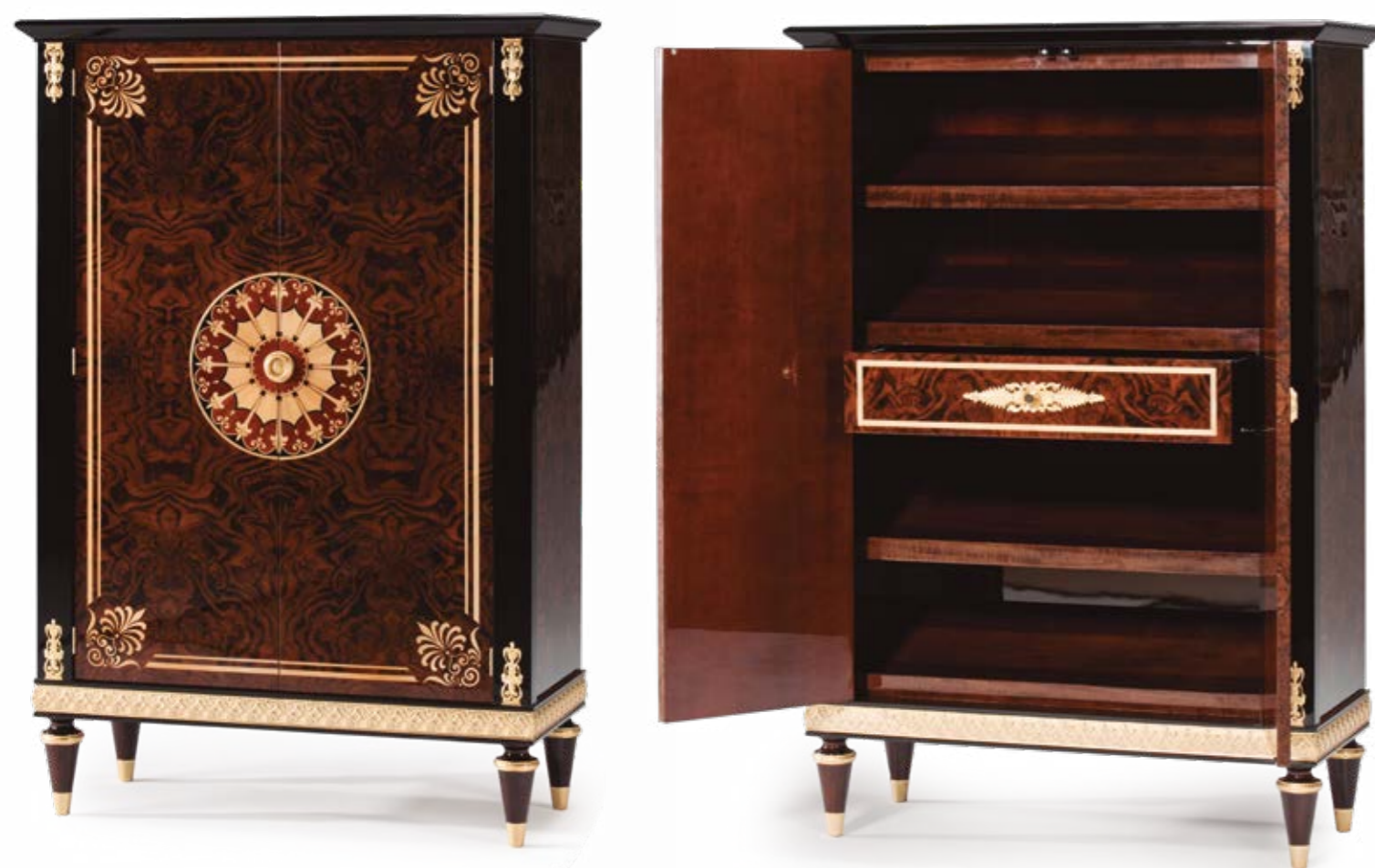
Estantería/Bookcase – Ref.: 50363 Altura/Height: 150 cm / 59,06" Ancho/Width: 100 cm / 39,37" Profundidad/Depth: 40 cm / 15,75" Peso neto/Net weight: 160 Kg / 352,42 Lb Acabado/Finish: NO/OA (19/231)

Materiales/Materials: Chapa de lupa de nogal y sicomoro y bronce / Walnut burl and sycamore veneer & casted bronzes.