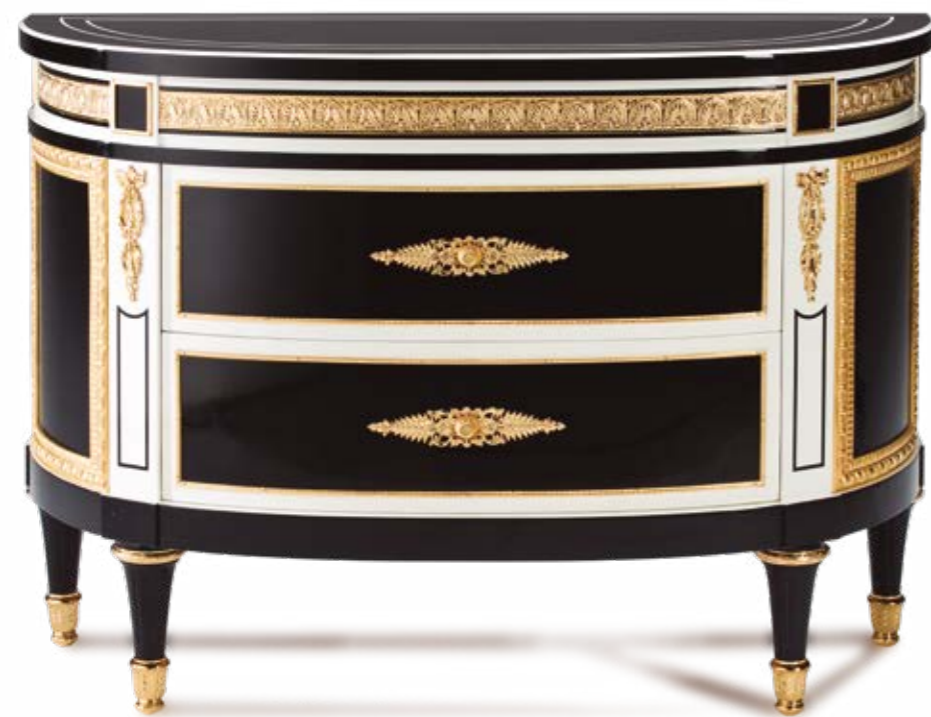
Cómoda/Chest of Drawers – Ref.: 50362 Altura/Height: 90 cm / 35,43" Ancho/Width: 129 cm / 50,79" Profundidad/Depth: 51 cm / 20,08" Peso neto/Net weight: 82 Kg / 180,62 Lb Acabado/Finish: WE.L.IDB (535/67)

MATERIALS: HIGH GLOSS BLACK PIANO AND WHITE, WITH POLISHED BRASS CASTE BRONZE ORNAMENTS AND CARVINGS DECORATED WITH ANTIQUE GOLD LEAF.