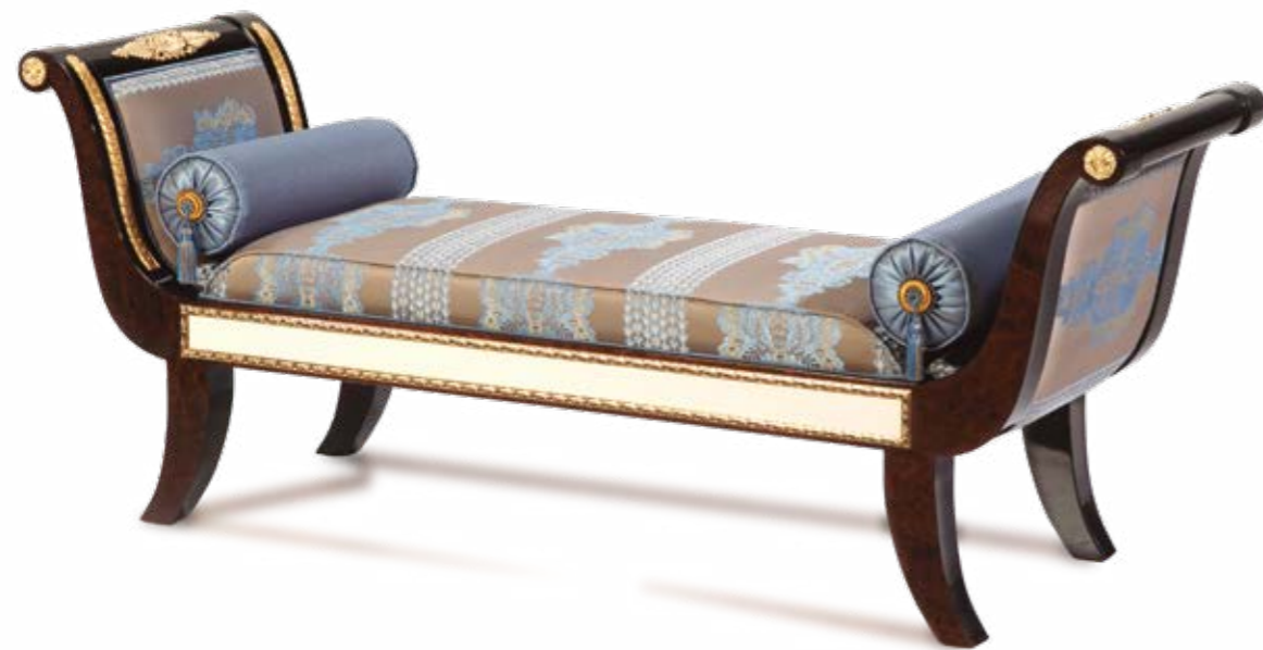
Banqueta/Bench – Ref.: 50303-2 Altura/Height: 67 cm / 26,38" Ancho/Width: 162 cm / 63,78" Profundidad/Depth: 51 cm / 20,08" Peso neto/Net weight: 25 Kg / 55,07 Lb Acabado/Finish: WE.W.IDB (536/67) Tela/Fabric n°: 241.157 / 241.158

MATERIALS: HIGH GLOSS WHITE, AND WALNUT BURL VENEER, WITH POLISHED BRASS CASTE BRONZE ORNAMENTS AND CARVINGS DECORATED WITH ANTIQUE GOLD LEAF.