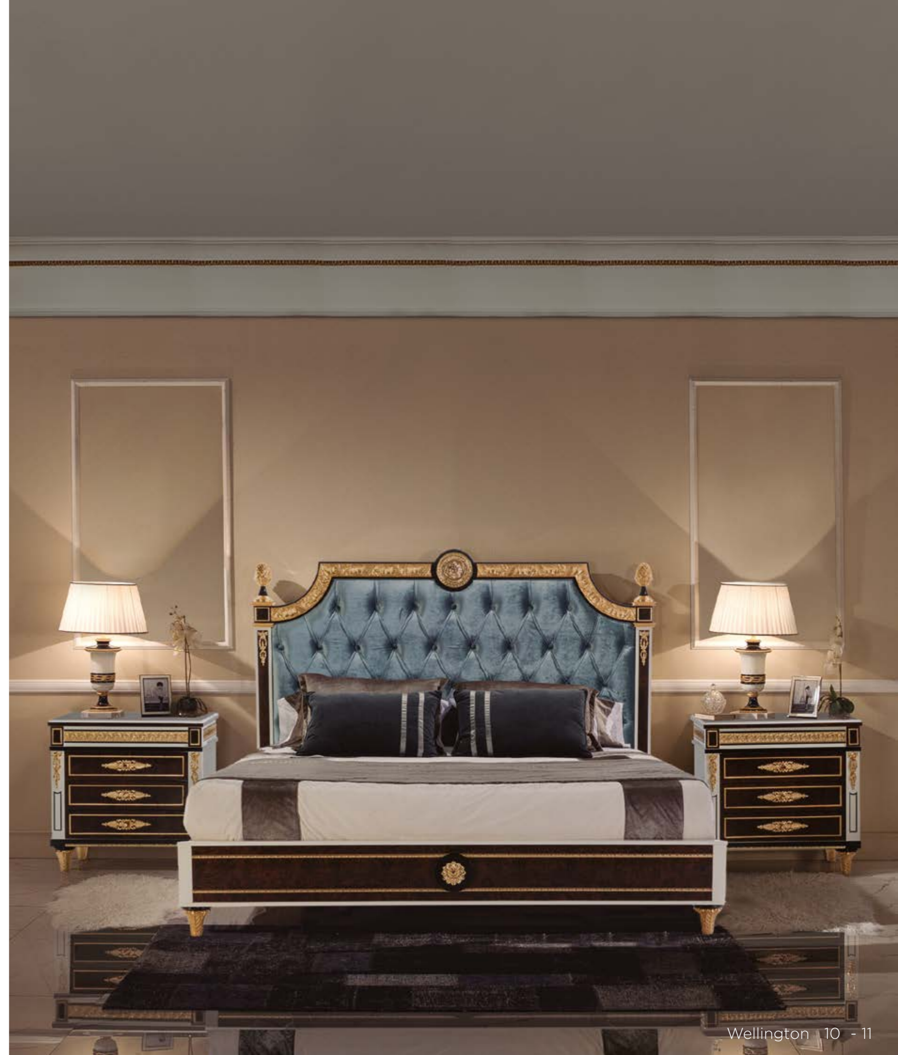
Cama/Bed – Ref.: 50299-2 ▶ Altura/Height: 162 cm / 63,78" Ancho/Width: 212 cm / 83,46" Profundidad/Depth: 220 cm / 86,61" Peso neto/Net weight: 118 Kg / 259,91 Lb Acabado/Finish: WE.W.IDB (536/67) Tela/Fabric n°: 243.031