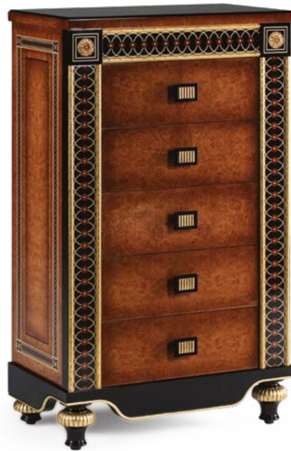
Chinfonier/Chest of Drawers – Ref.: 50386 Altura/Height: 134 cm / 52,76" Ancho/Width: 78 cm / 30,71" Profundidad/Depth: 45 cm / 17,72" Peso neto/Net weight: 105 Kg / 231,28 Lb Acabado/Finish: NAN.IOF (544/55)

MATERIALS: OAK BURL VENEER, SYCAMORE INLAYS & CASTED BRONZE.