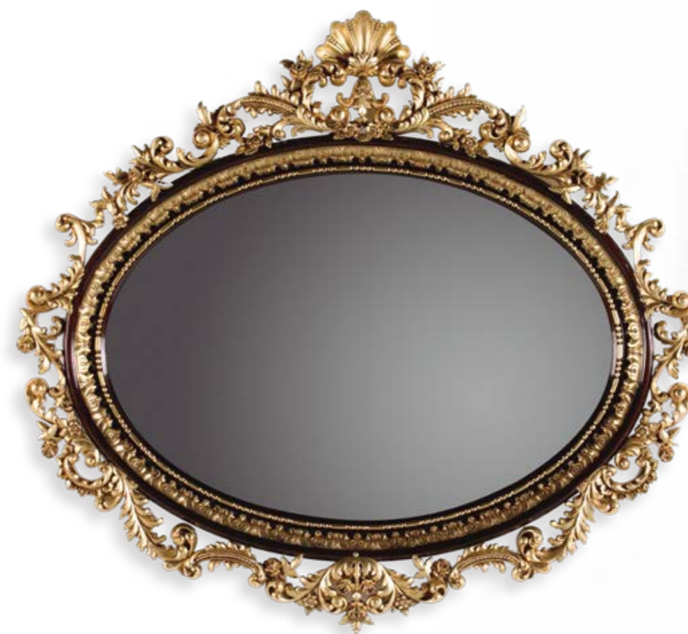
Marco/Mirror – Ref.: 50356 Altura/Height: 150 cm / 59,06" Ancho/Width: 137 cm / 53,94" Profundidad/Depth: 9 cm / 3,54" Peso neto/Net weight: 21 kg / 46,26 Lb Acabado/Finish: NO.PO.B (547)

Materiales/Materials: Talla decorada en pan de oro envejecido / Hand carved wood decorated in old gold leaf.