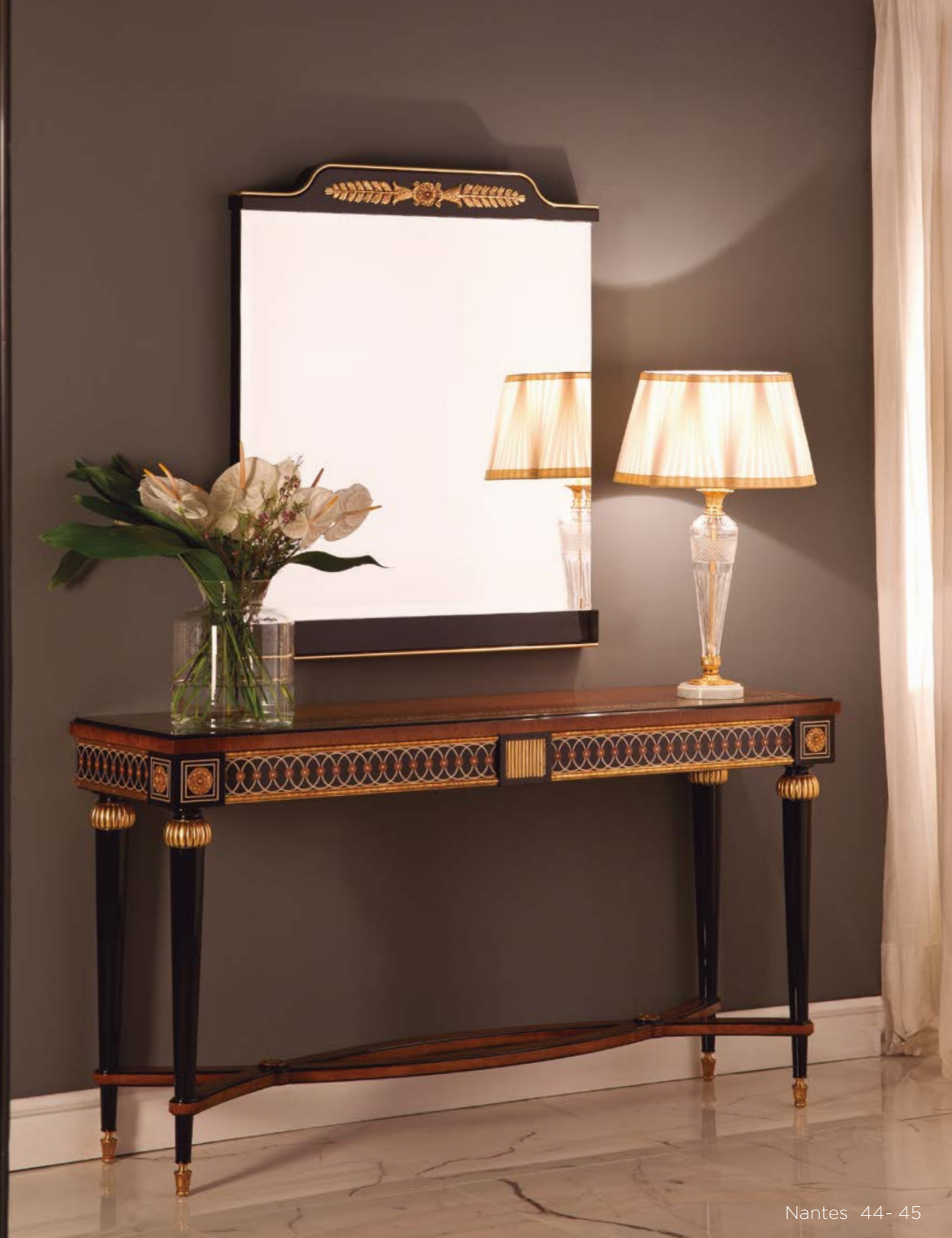
Marco/Mirror – Ref.: 50348 ▶ Altura/Height: 104 cm / 40,94" Ancho/Width: 94 cm / 37,01" Profundidad/Depth: 6 cm / 2,36" Peso neto/Net weight: 26 kg / 57,27 Lb Acabado/Finish: NAN./OF (544/55)