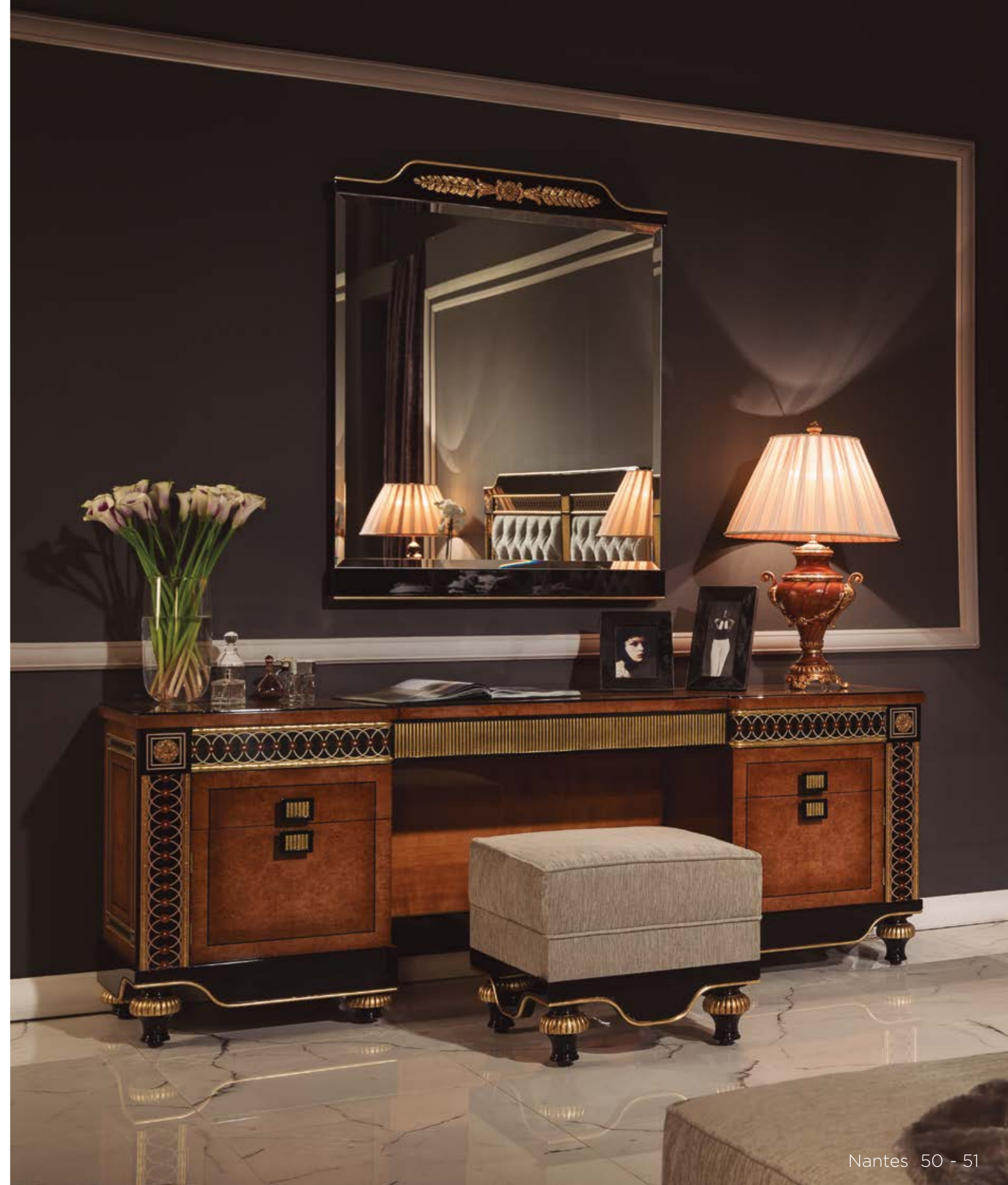
Coqueta/Dressing Table – Ref.: 50383 ▶ Altura/Height: 80 cm / 31,50" Ancho/Width: 210 cm / 82,68" Profundidad/Depth: 48 cm / 18,90" Peso neto/Net weight: 127 Kg / 279,74 Lb Acabado/Finish: NAN.IOF (544/55)