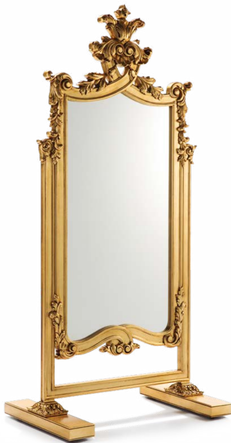
Marco/Mirror – Ref.: 50465 Altura/Height: 229 cm / 90,16" Ancho/Width: 107 cm / 42,13" Profundidad/Depth: 70 cm / 27,56" Peso neto/Net weight: 37 Kg / 81,50 Lb Acabado/Finish: POE (380)

Materiales/Materials: Talla decorada en pan de oro envejecido / Hand carved wood decorated in old gold leaf.