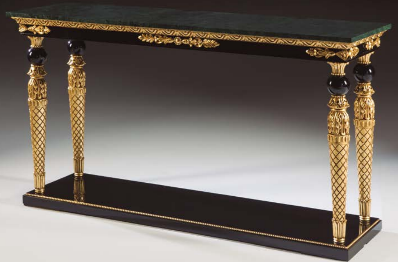
Consola/Console – Ref.: 50410 Altura/Height: 85 cm / 33,46” Ancho/Width: 168 cm / 66,14” Profundidad/Depth: 53 cm / 20,87” Peso neto/Net weight: 71,00 Kg / 156,39 Lb Acabado/Finish: POE/INB (425)

Materiales/Materials: Mármol blanco Calacatta y talla decorada en pan de oro envejecido / Calacatta white marble & hand carved wood decorated in old gold leaf.