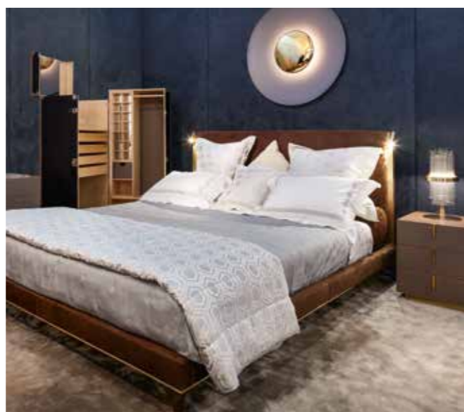
GEORGE IN BEIJING