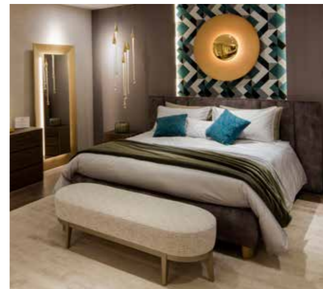
STRIPES IN NEW YORK