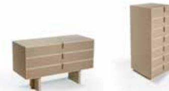
FINE COLLECTION chest of drawers 3 & 7