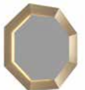
BEST WORLD octagonal