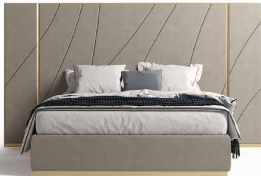
SLEEPING DESTINATION: MILAN

“Milan has its own magic of dazzling lights and roads to go through without wondering what the destination is. Because wherever you walk, you will feel like you are at the center of the world.” (Fabrizio Caramagna)