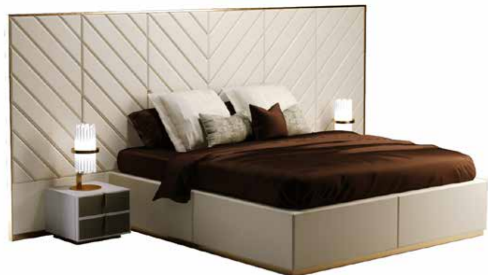
SLEEPING DESTINATION: MOSCOW

“It appeared to me then as a great black line, from which rose a forest of bell towers and domes, which stood out above the intense red of a sky from which the sun had just set. It was a grand and fantastic show. On a clear day, from the top of Ivan Veliki’s bell tower, in the center of the Kremlin, I had seen the golden domes of the immense city of 345 churches shining around me with dazzling light, in the middle of the vast sea of green roofs blending with the trees of the innumerable gardens.”