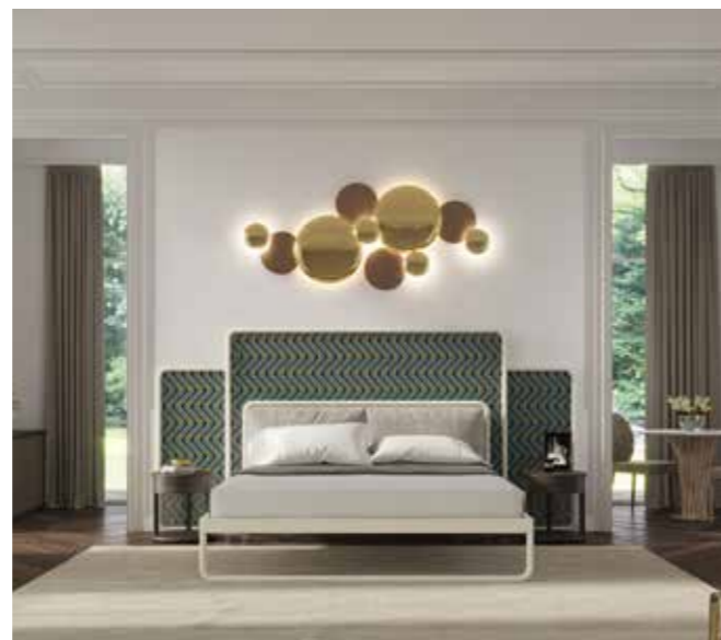
TUM AMET IN PARIS