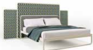
TUM AMET bed