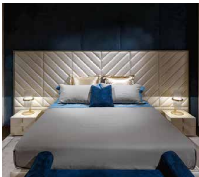
REGENCY IN MOSCOW