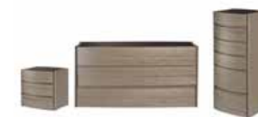
DEA night storage