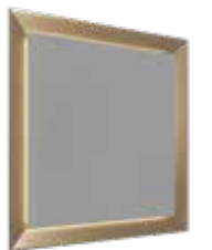
BEST WORLD square