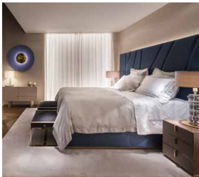
ODISSEA IN MILAN