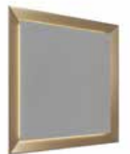
BEST WORLD square