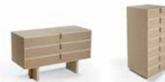
FINE COLLECTION chest of drawers 3 & 7